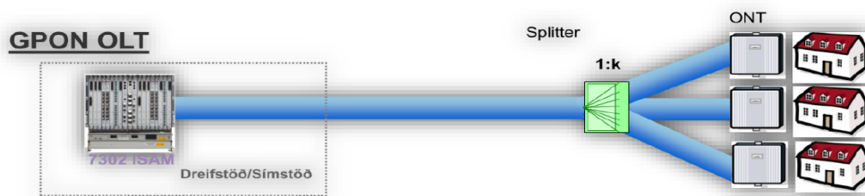
Mynd 2: Eins lags deiling